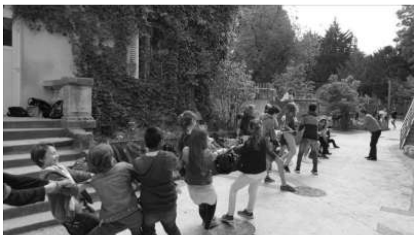
Olympiades des 4èmes