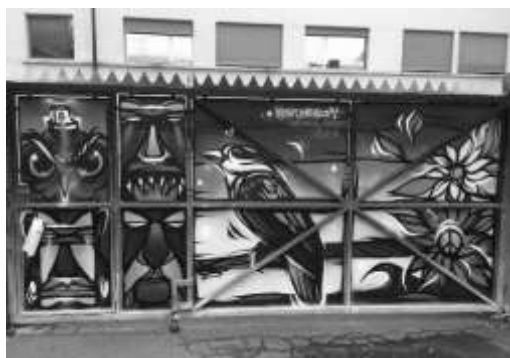
Artiste : Mosko