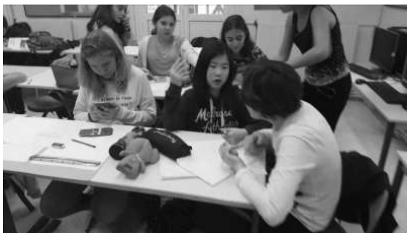
EPI de 5 e