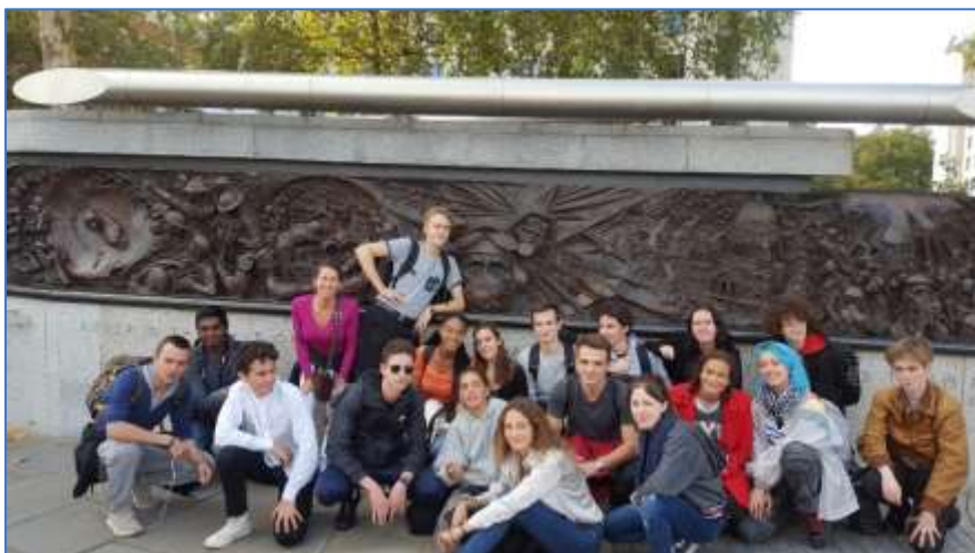
The Battle of Britain Memorial