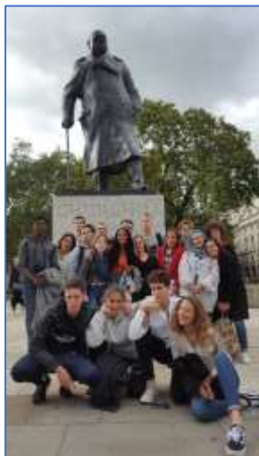
Le grand homme, Churchill

« Plus vous saurez regarder loin dans le passé, plus vous verrez loin dans le futur. »