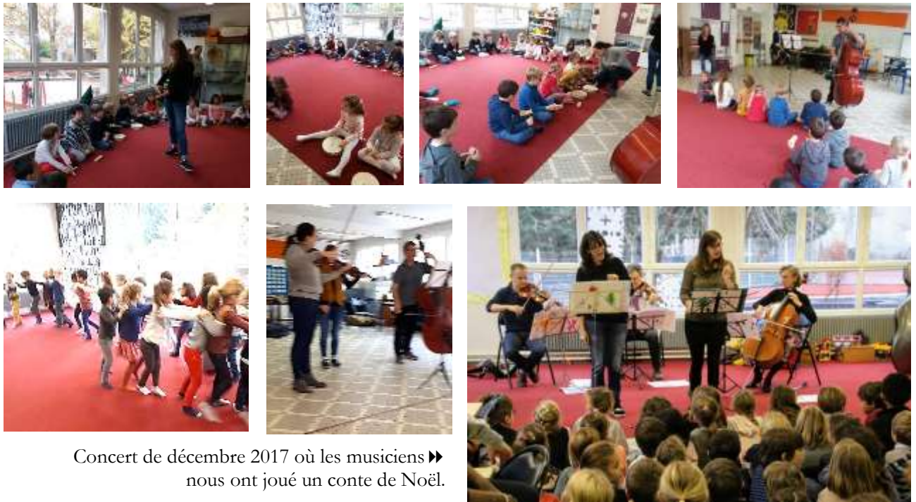
Concert de décembre 2017 où les musiciens ► nous ont joué un conte de Noël.