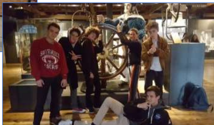
The Docklands museum