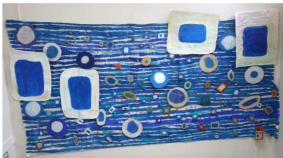
D'après Klimt, fresque XXL en relief réalisée par les CM2