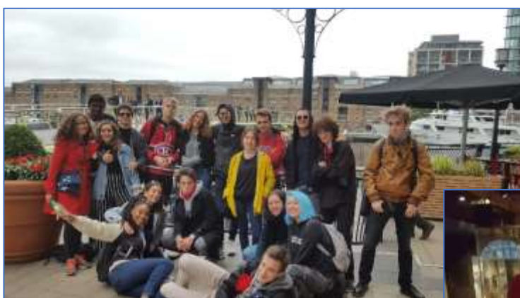
The Docklands at Canary Wharf